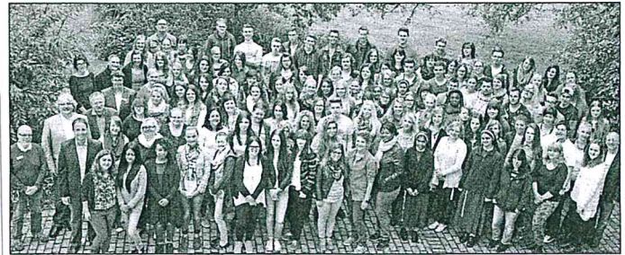
Ein neuer Lebensabschnitt beginnt für die 130 Auszubildenden, die seit 1. September an der KBS lernen.